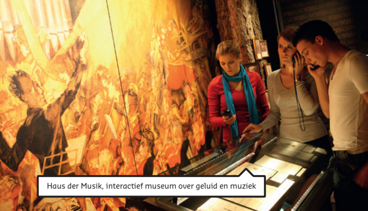
Haus der Musik, interactief museum over geluid en muziek

woonden zoveel beroemde musici in Wenen? Op dit soort vragen probeert het museum antwoord te geven, onder meer door middel van interactieve spelletjes. De eerste verdieping is gewijd aan de geschiedenis van het filharmonisch orkest, vanaf het moment van oprichting. Op de tweede verdieping mogen je oren actief meedoen in de Sonosphere , waar je je eerste ervaringen met geluid in de buik van je moeder herbeleeft, en in het Instrumentarium waar supergrote muziekinstrumenten worden getoond. De derde verdieping is een eerbetoon aan de Weense muziektraditie en de beroemde componisten en musici die bepalend zijn geweest voor de geschiedenis van de stad (Haydn, Mozart, Beethoven, Schubert, Strauss en Mahler). Je kunt op deze verdieping zelf virtueel dirigent zijn van het Weens filharmonisch orkest! De vierde verdieping, de Futuresphere , gaat over de toekomst en het ontstaan van muziek. Door middel van bewegingen, aanrakingen en je stem kun je hier zelf muziek maken.