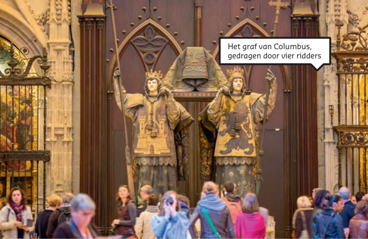
Het graf van Columbus, gedragen door vier ridders

in de 17de eeuw af uit de hemel om de Giralda te steunen en te verhinderen dat hij instortte.