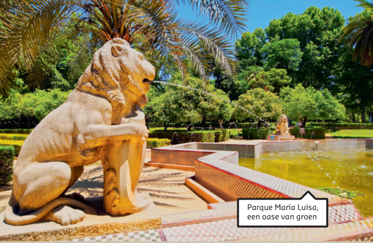
Parque María Luisa, een oase van groen