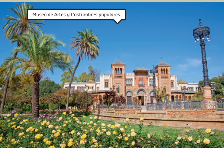
Museo de Artes y Costumbres populares

Zelfde openingstijden, tarieven en kortingen als het Archeologisch Museum. Prachtig gebouw met twee bakstenen torens en marmeren zuilen. Binnen vind je kledingstukken (mooi kantwerk), muziekinstrumenten, religieuze voorwerpen, interessant meubilair ... Kortom, een allegaartje dat al met al een beetje saai is en dat er vooral lijkt te zijn neergezet om de ruimte te vullen.